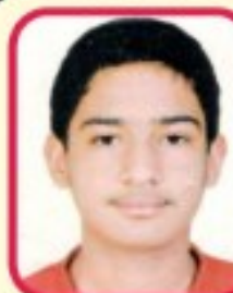
Rank-1, A-2 makuwala Pratham