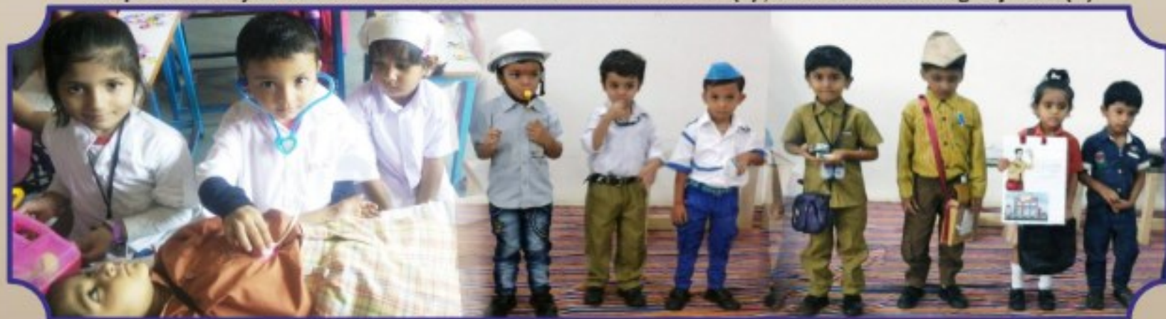
'Our Helper's Week' Celebrated by Tiny Tots of Amity Play Centre.