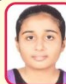
Rank-1, A-2 Bhadra Bansari