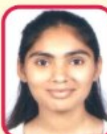
Rank-3, A-2 Modi Dhvani